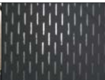
Usinage de formes rectangulaires.