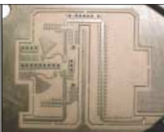
Découpe de circuits hyperfréquence en RO 6002.